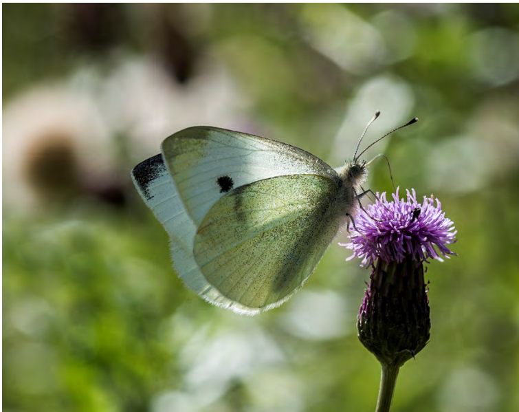
Rovfjäril, hona (Tyktoorp).