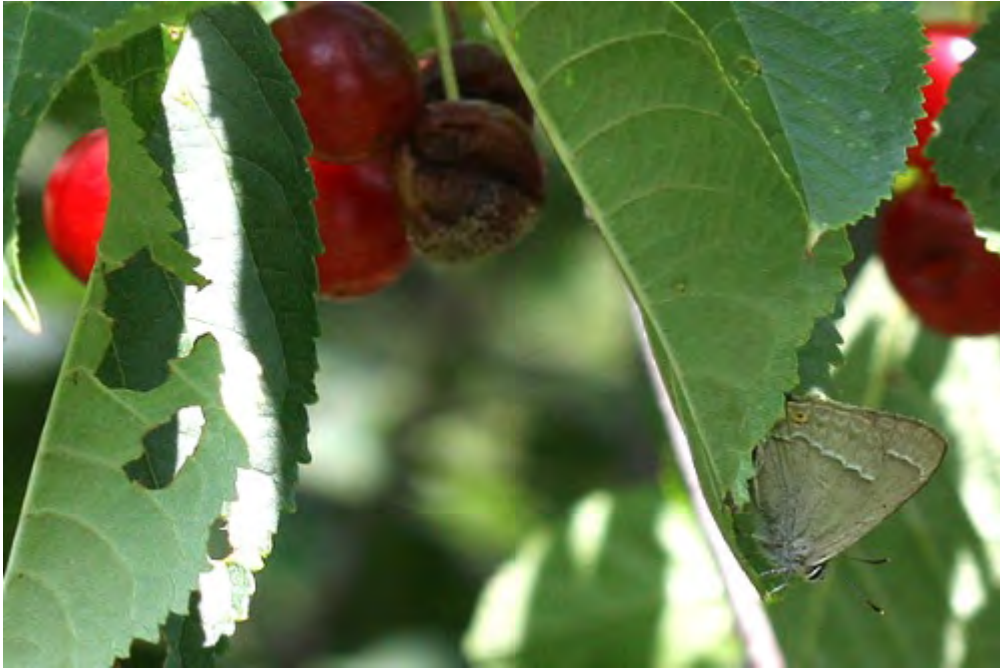
Eksnabbvinge (Jaktstigen).