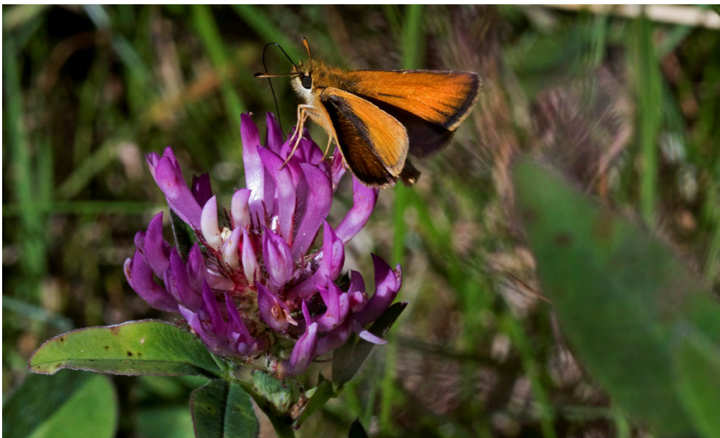
Mindre tätelsmygare (Rudalid).