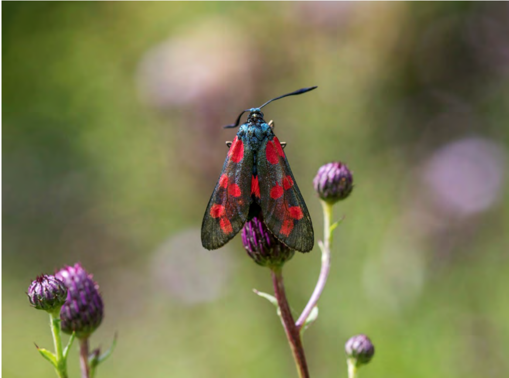
Sexfläckig bastardsvärmare (nära Trolldalstippen).