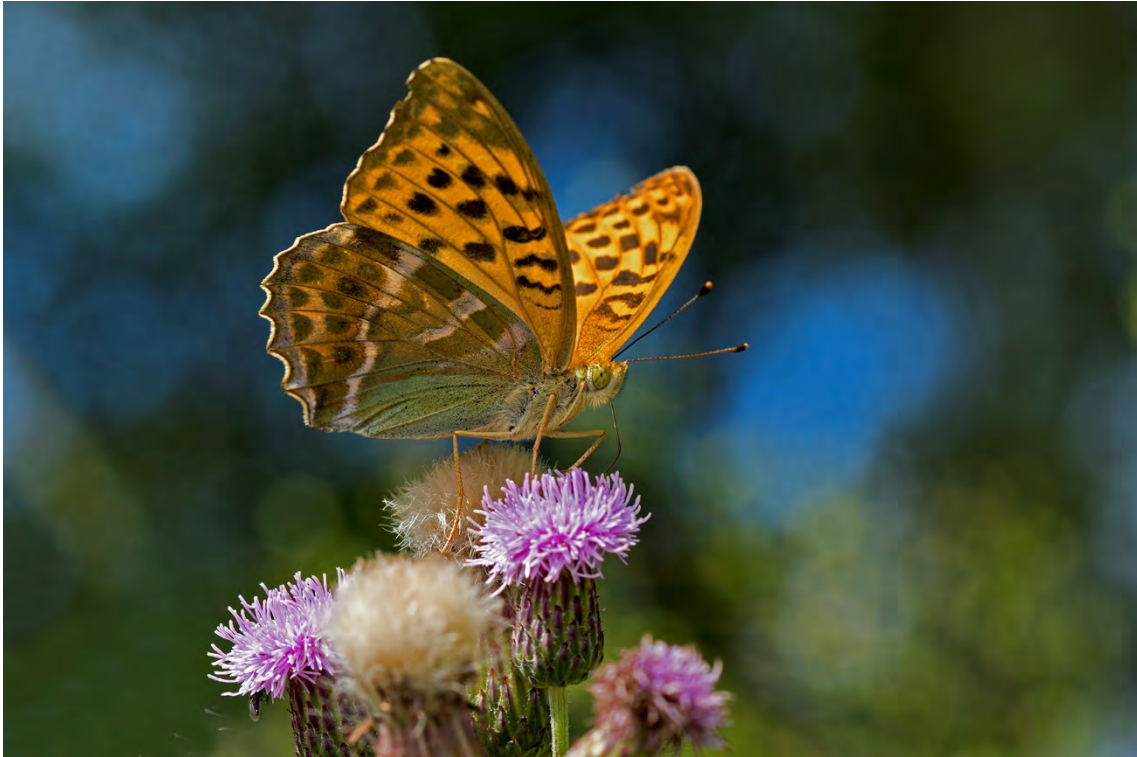
Silverstreckad pärlemorfjäril (nära Trolldalstippen).