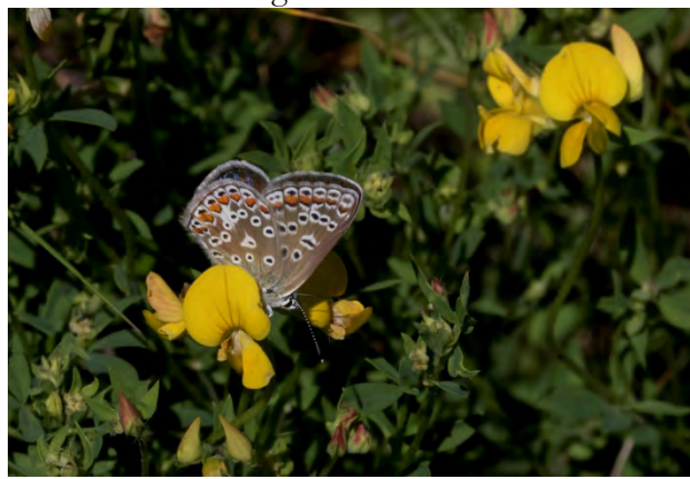
Puktörneblåvinge, hane ovan t.v., undersida (t.h.) och hona (nedan).