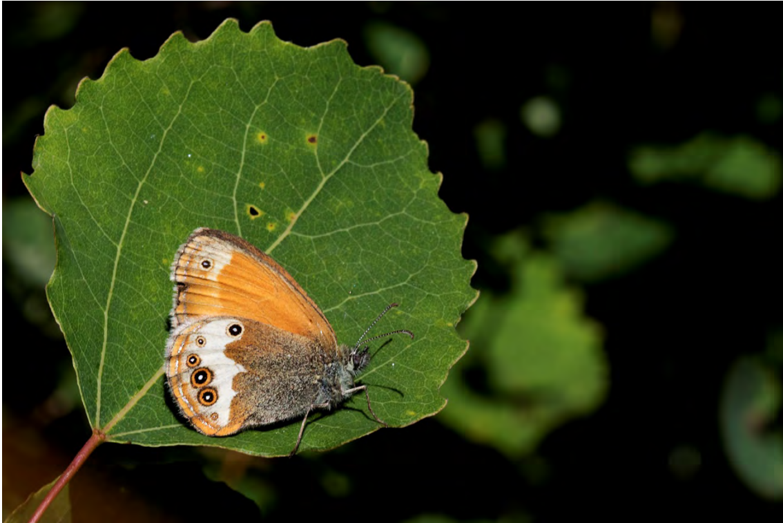
Pärlgräsfjäril (inre Kyrkviken).