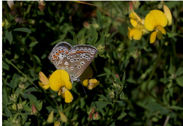
Puktörneblåvinge, hane ovan t.v., undersida (t.h.) och hona (nedan).