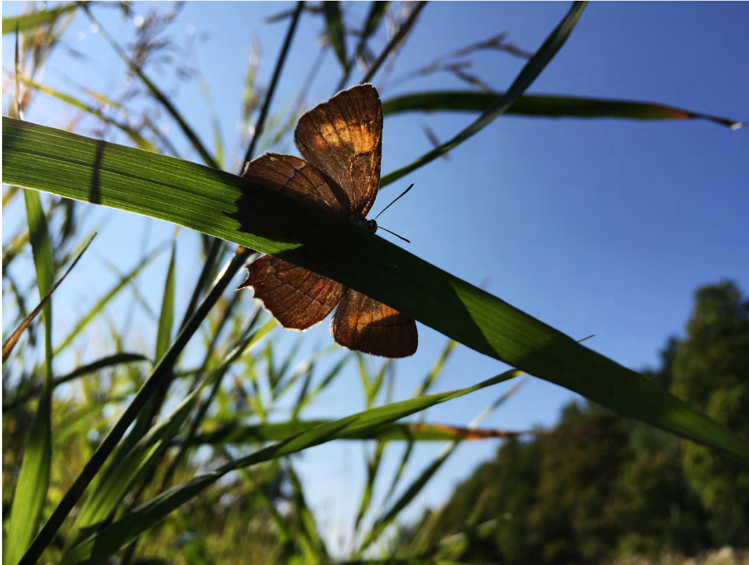
Eldsnabbvinge, hona (Tykatorpsdälden).