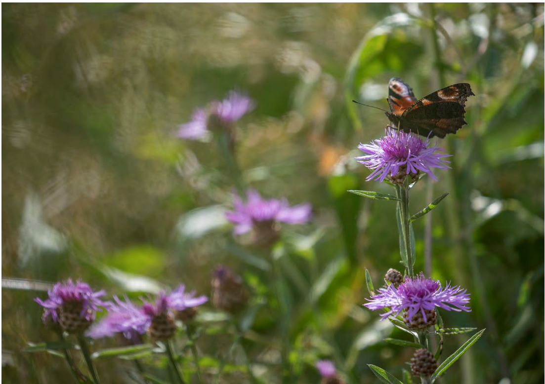
Påfågelöga (Trolldalstippen).