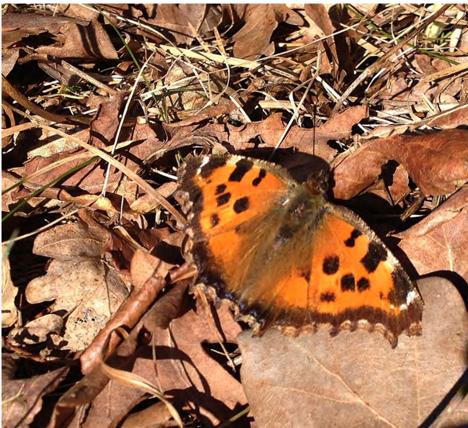
Videfuks (Södergarn i mars 2015).