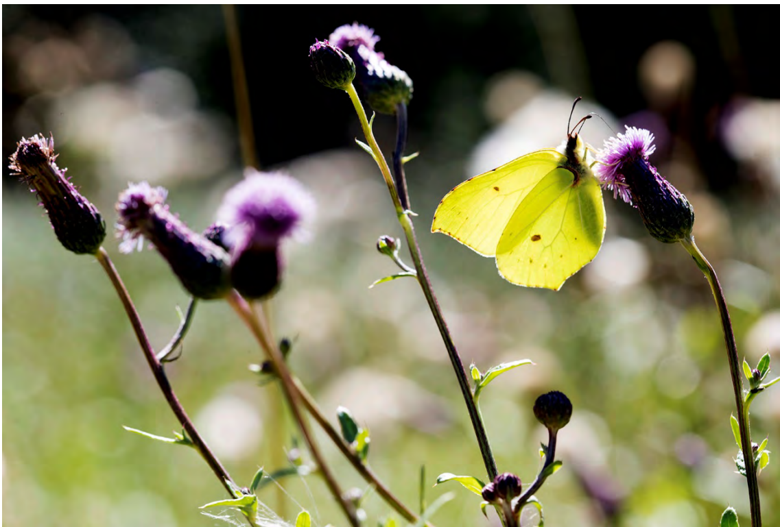
Citronfjäril, hane (Tyktorpsdälden).