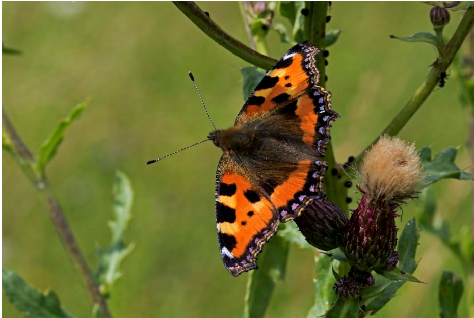
Nässelfjäril (Tykatorpsdälden).