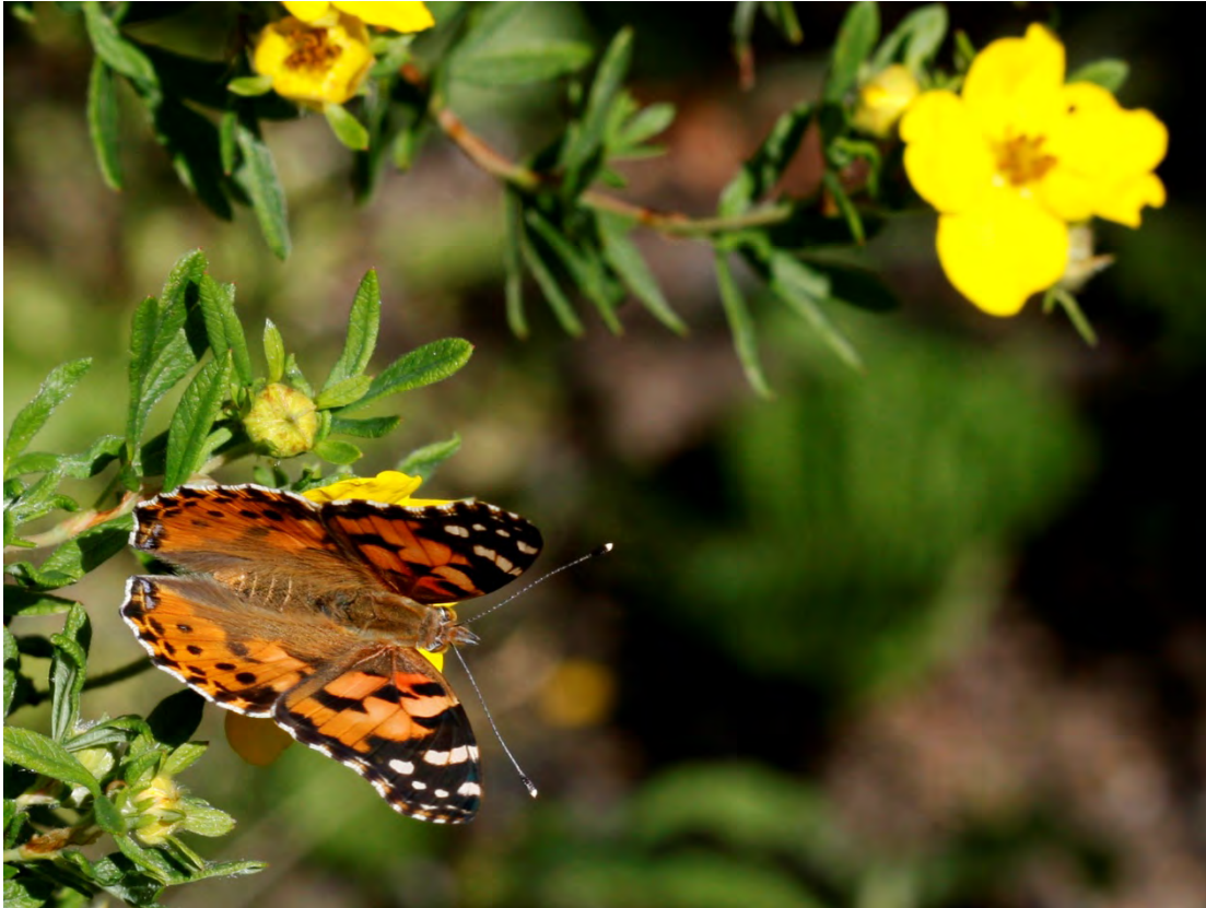
Tistelfjäril (Kyrkvägen 26).