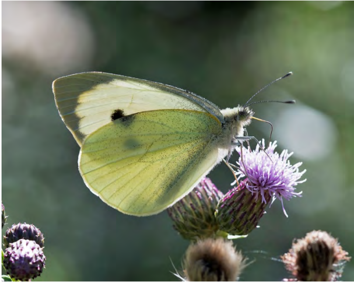
Kålfjäril, hona (Tyktoorp).