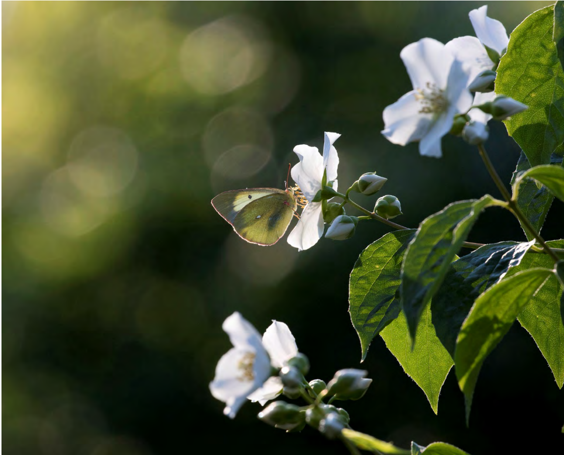
Svavelgul höfjäril (Kyrkv., överst, och Långnäs, underst).