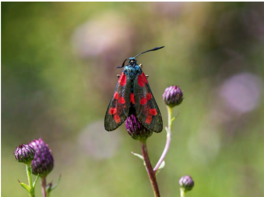
Sexfläckig bastardsvärmare (Trolldalstippen).