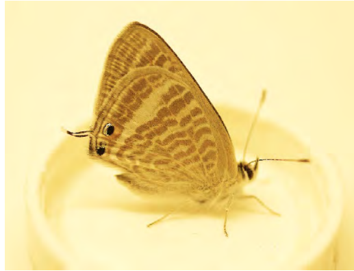
Tostebåvinge. och långsvansad blåvinge (Käppala).