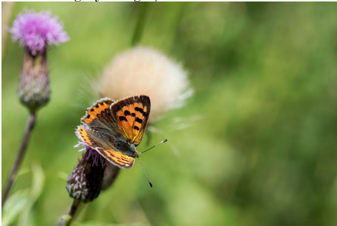
Mindre guldvinge (Tykatorp).