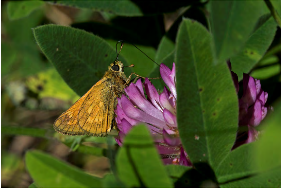
Ängssmygare (Rudalid).