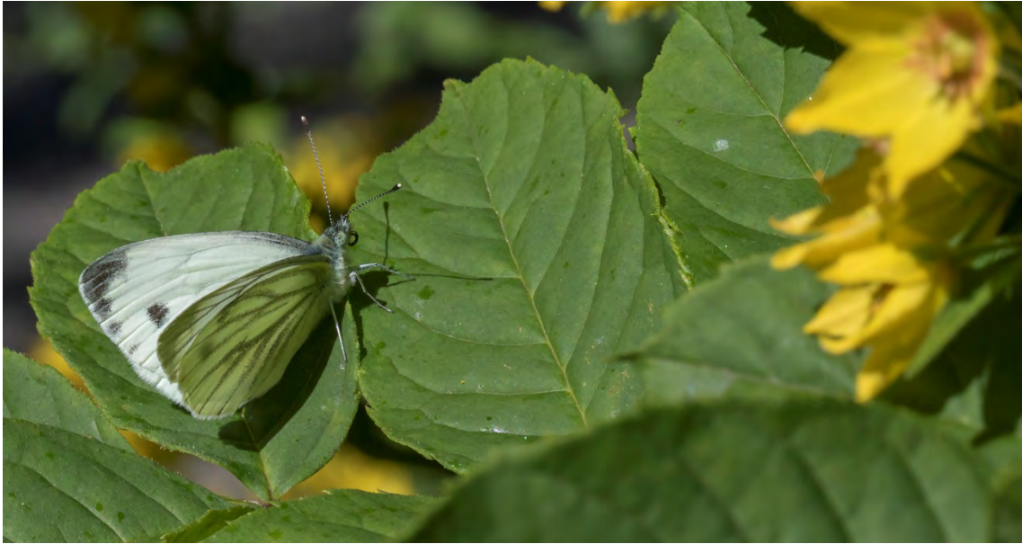
Rapsfjäril (inre Kyrkviken).