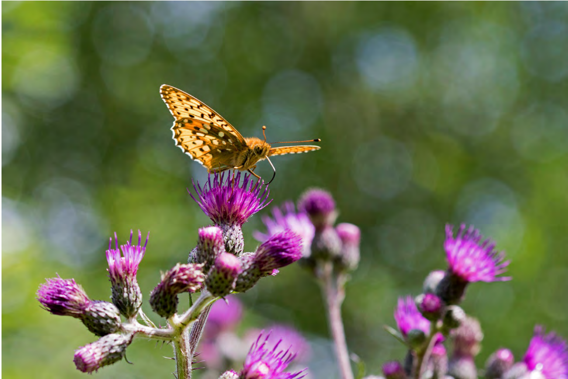
Ängspärlemorfjäril (nära Trolldalstippen).