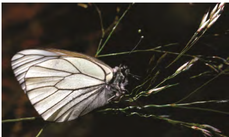
Hagtornsfjäril (Elfvik).