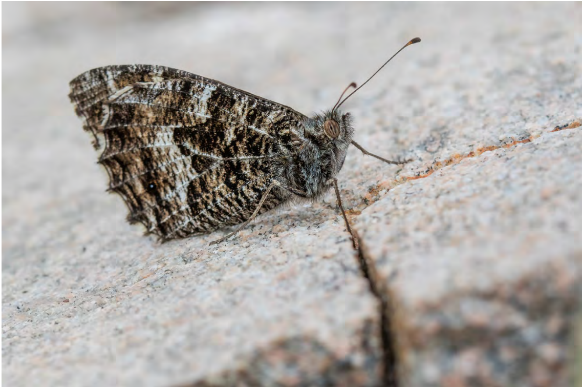
Sandgräsfjäril (Kappsta).