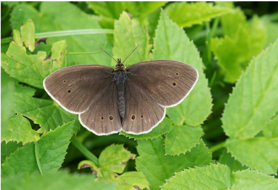
Luktgräsfjäril (Skärsättradalen).