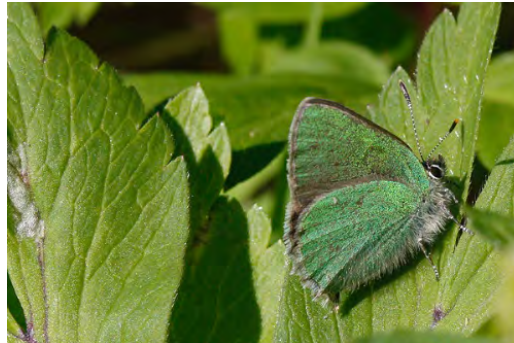
Grönsnabbvinge (Rudalid).