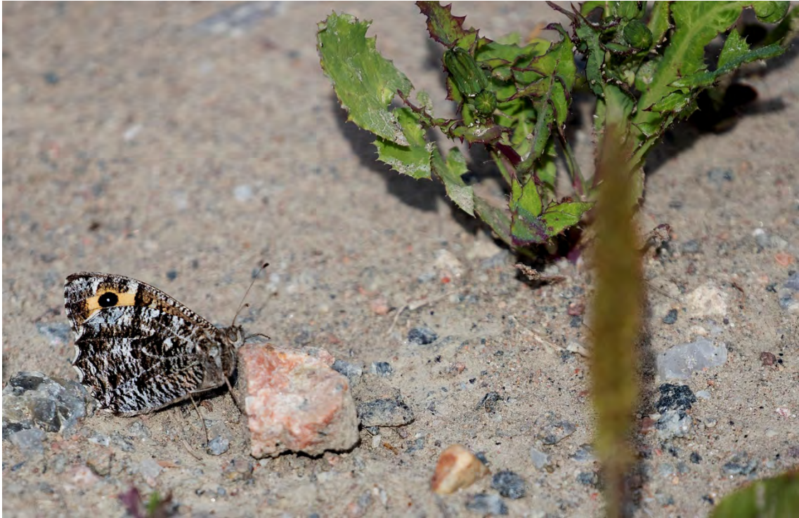
Sandgräsfjäril (Trolldalstippen).