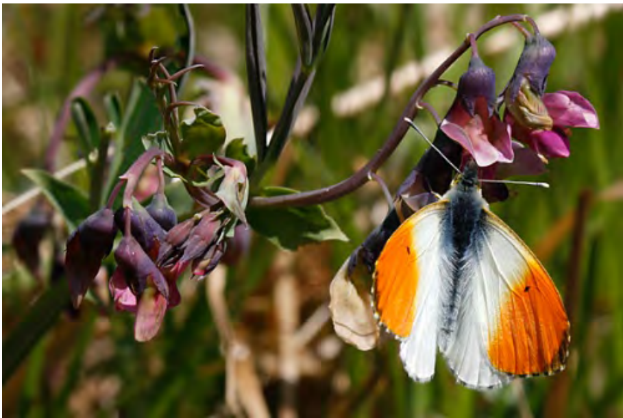
Aurorafjäril, hane (Rudalid).