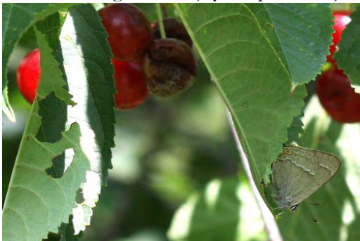
Eksnabbvinge (Jaktstigen).